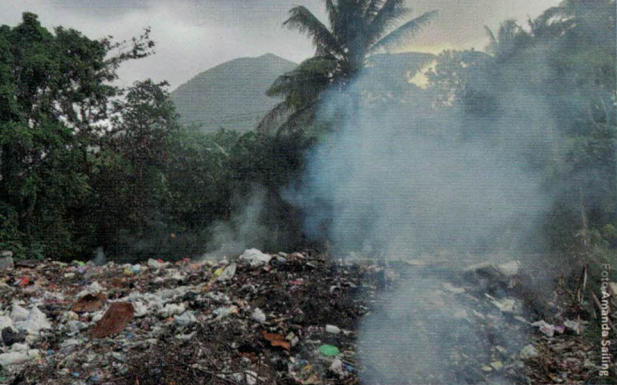
Ulmende søppelfylling i Sør-Molukkende. Ikke sjeldent syn i Indonesia.