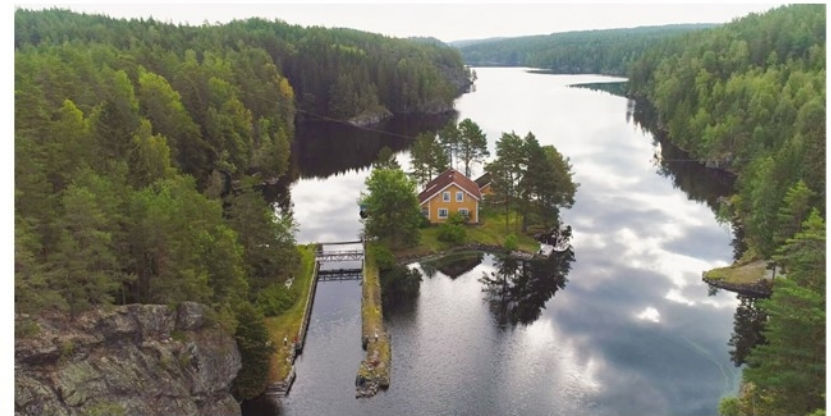
Over + øverst til venstre: Krappeto Sluseanlegg som idag ligger under vann